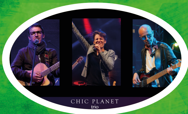
CHIC PLANET trio

Chic Planet besteet aus professionelle Museker, déi vill Erfahrung am Entertainment Beräich gesammelt hunn. Si spille Musek aus folgende Styler: Pop, Rock, Soul, Jazz, Latino, Electro/Dance an Disco.